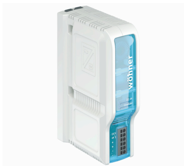
Obr. 2 Osazení přípojnícového systému CrossBoard komponenty

Obecně platí, že komponenty vyráběné společností Wöhner nabízí snadnou montáž, demontáž a výměnu díky jednoduchému systému upevňování, dále pak zaměnitelnost plynoucí ze stoprocentní modularity systémových komponent, efektivní využitelnost prostoru systémů